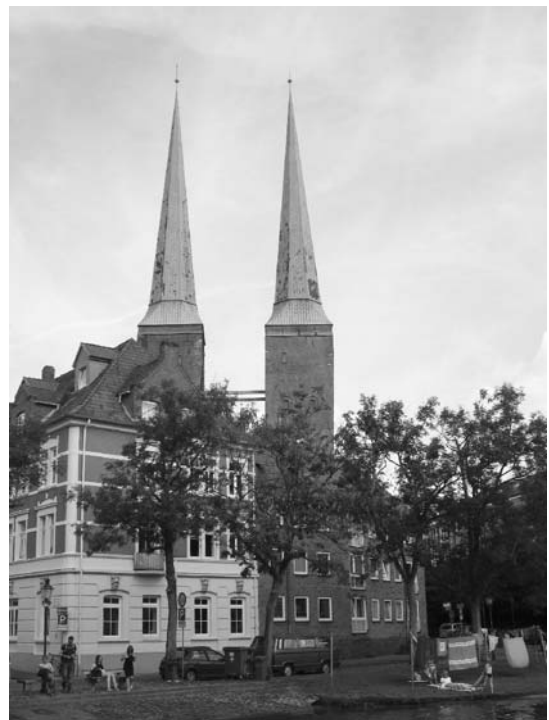
Der Lübecker Dom mit seinen Türmen