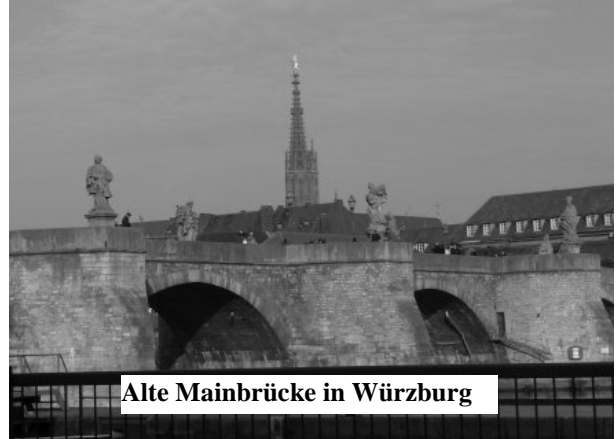
Alte Mainbrücke in Würzburg

Die Würzburger Residenz wurde 1981 UNESCO-