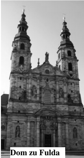
Dom zu Fulda

Die Ziele unserer diesjährigen Wochenendreise waren zwei Städte in zwei Bundesländern, nämlich Fulda in Hessen und Würzburg im Freistaat Bayern. Wir fuhren der Sonne entgegen und erreichten Fulda am frühen Nachmittag. Im „Holiday Inn“ angekommen, erwarteten uns auch schon zwei Stadtführerinnen. Im Focus der Führung standen die barocken Bauten der Stadt, insbesondere der Dom, die bedeutendste Barockkirche Hessens, und das Schloss.